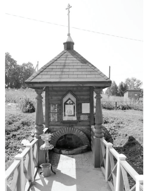
Святой источник в честь великомученика Пантелеймона. Село Усты.

А 4 ноября приглашает всех желающих на богослужение в светлый, чистый, теплый храм с.Усты. Добро пожаловать!