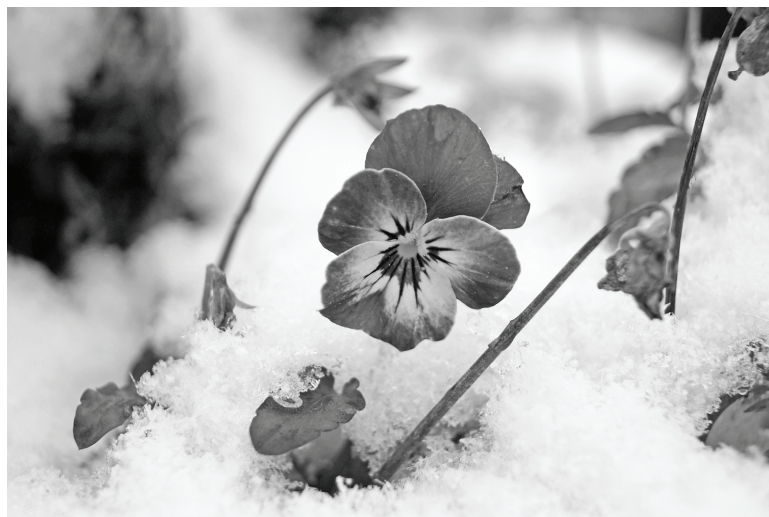
Вот это «подснежник»!