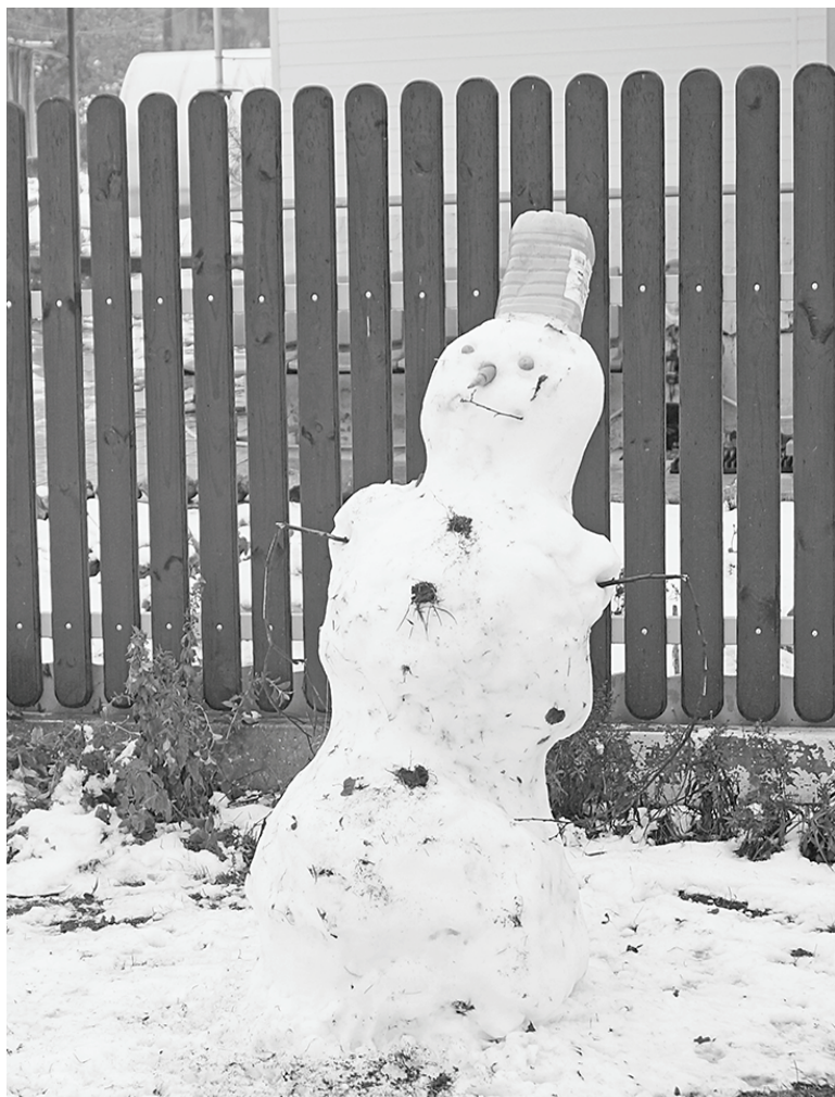
Снеговик-«октябрёнок». Ст. Думиничи, 26 октября.

Кажется, совсем недавно были в «районке» заметка и снимок с журавлями в небе. Со времени пролета прекрасных птиц прошло ровно две недели, и вот 26 октября Думиничи накрыло снеговым одеялом.